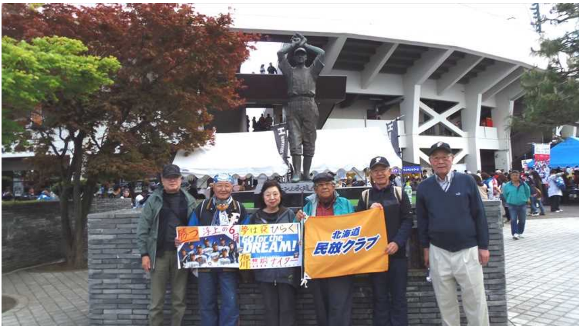
スタルヒン銅像前でまずは記念撮影

試合終了後は3・6街で勝利を祝うはずだったけど、寒いこともあってホテル前の焼き鳥屋で祝杯を挙げてお開きとなった。